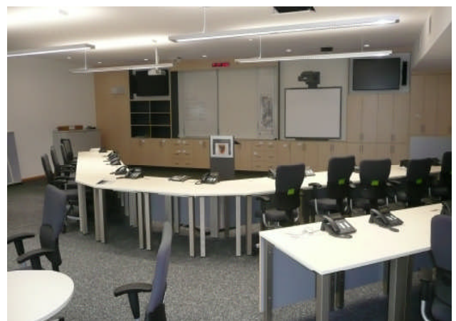
Bild oben Leitstelle, Bild unten Stabsraum