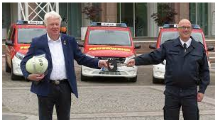
Schlüsselübergabe vom OB Ullrich Sierau an den Chef der Feuerwehr Dortmund Dirk Aschenbrenner

Der zweite Bauabschnitt der neuen Feuerwache 1 wurde fertiggestellt. Am 13.09.2012 wurde die Feuer- und Rettungswache durch den Oberbürgermeister Ullrich Sierau offiziell an die Feuerwehr übergeben.