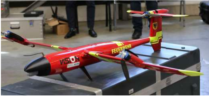
Das Flugsystem zur Erkundung

Fliegendes Robotersystem zur Detektion und Analyse freigesetzter, gasförmiger Schadstoffe mittels FTIR-Spektroskopie und Visualisierung der Messdaten als 3D-Wolke in einer Karte