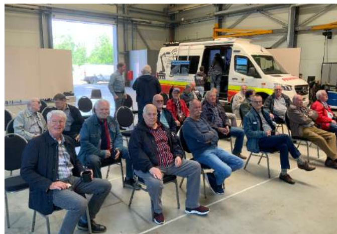
Die ALTEN Löschknechte wieder auf der Schulbank

Nach einer kurzen Einführung mit der Vorstellung der Arbeiten beim IFR und dem DRZ wurden insgesamt sieben Forschungsprojekte vorgestellt. Der Leitsatz der Feuerwehren „Löschen – Retten - Bergen-Schützen“, wird hier um den Punkt Forschen erweitert.