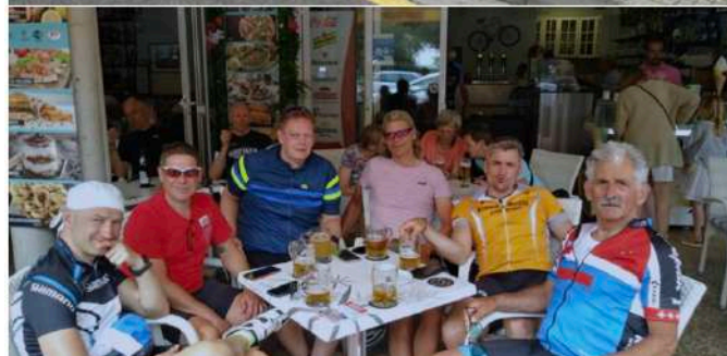
Vor dem Start, warten auf den Rest der Truppe (oben) und kurze Erfrischungspause (unten).