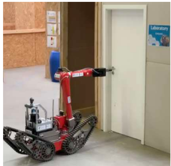
Der Bodenroboter bei der Türöffnung

Die Möglichkeiten von praktischen Anwendungen einer Drohne bei unübersichtlicher Lage wurde erläutert und in der Erkundung eines Trümmerfeldes praktisch vorgeführt. Weiterhin konnte der Bodenroboter seine Fähigkeiten zeigen, hier wurde eine Tür geöffnet, die dahinterliegenden Räume erkundet, eine Gaszufuhr abgesperrt und ein Gefäß mit ätzenden Flüssigkeiten mit einem Stopfen verschlossen. Insgesamt wurden die Pensionäre in gut 2 ½ Stunden mit einer Flut von „Neuem“ gefüttert und man konnte sich einen Eindruck verschaffen, wie die Feuerwehr der Zukunft aussehen könnte, wenn alle Projekte erfolgreich beendet werden könnten.