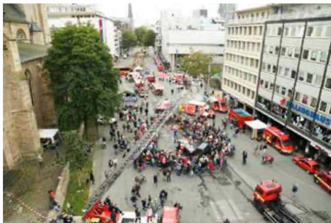
Rund um die Reinoldikirche präsentiert sich die Feuerwehr Dortmund

Mit der Gründung der Dortmunder Berufsfeuerwehr am 1 Oktober 1901 konnte die Feuerwehr im Jahr 2013 ihr 112-jähriges Bestehen mit diversen Veranstaltungen feiern – auch in 2014 standen noch viele Veranstaltungen unter diesem Motto Letzte Veranstaltung im Zusammenhang mit diesem Jubiläum war der bekannte Stadtfeuerwehrtag rund um die Reinoldikirche in der Innenstadt im August 2014.