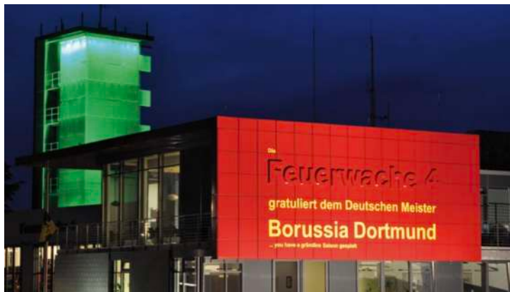
Die Feuerwache 4 feiert mit

Im Mai feierten hunderttausende BVB-Fans, nach gewissenhafter und aufwendiger Einsatzplanung, friedlich die Deutsche Fußballmeisterschaft und den Gewinn des Pokales von Borussia Dortmund.