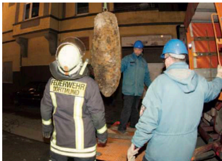
Der Zünder ist raus

Ende November wurde bei Bauarbeiten eine Fliegerbombe in der Dortmunder Innenstadt gefunden. Für die Entschärfung mussten kurzfristig tausende Bewohner evakuiert werden.