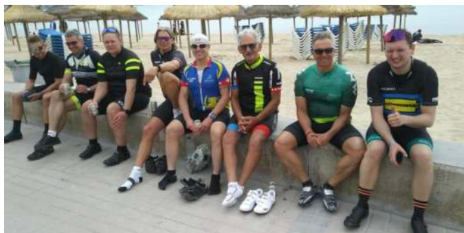
Nach jeder Tour kurze Lagebesprechung immer auf der gleichen Mauer am „Standort“ El Arenal

Vom 27.04. bis zum 05.05. wurden jeden Tag verschiedene Ziele auf der Insel angefahren und immer um die 100 km zurückgelegt, insgesamt wurden stolze 766 km abgestrampelt.