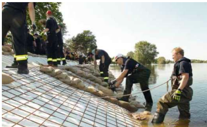
Dortmunder Kräfte beim Deichbau

Zwei Einsätze des Jahres 2013 werden sicherlich noch lange im Bewusstsein der Feuerwehrfrauen und -männer, aber auch der Bevölkerung bleiben: Im Juni unterstützte die Feuerwehr Dortmund zusammen mit weiteren Kräften aus dem Regierungsbezirk Arnsberg, den Kampf gegen das Elbehochwasser in Niedersachsen. Über mehrere Tage bauten die Dortmunder Feuerwehrleute Behelfsdeiche auf und ertüchtigten vorhandene Deichanlagen. Im weiteren Einsatzverlauf übernahm die Feuerwehr Dortmund dann die Führung der eingesetzten Einheiten des Regierungsbezirkes Arnsberg.