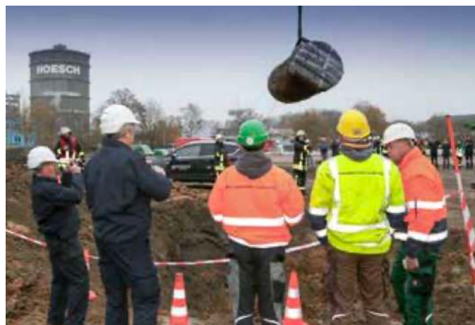
Die Luftmine am Haken

besonderen Bombenfunds verlief ohne Komplikationen