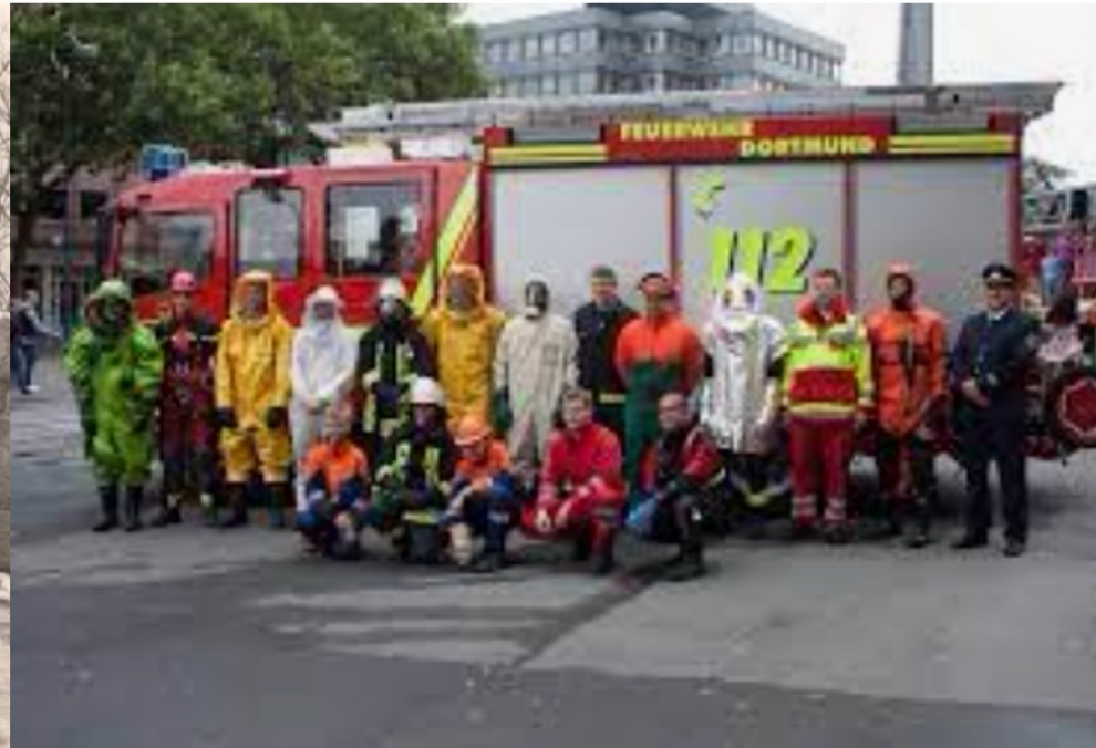
„Modenschau“ 1960 und 60 Jahre später 2020